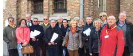
Wij komen bij u langs p. 3