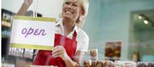
Stadsbestuur mist economische visie p. 2