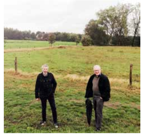
▲ Het stadsbestuur en de volledige gemeenteraad keurden de aanvraag gelukkig af.

Het dossier van de Mispelaar/Minnaertstraat wordt beheerd door Vivendo. Dat is de huisvestingsmaatschappij waarvan de Brugse burgemeester voorzitter is. “Dat is alsof een particulier of bedrijfs-