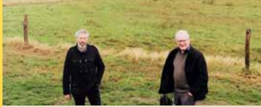
Stop de bouwwoede in Assebroek (p.2)